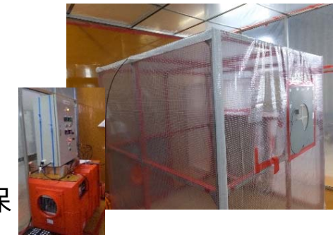
【クリーンハウス筐体、負圧制御装置外観図】