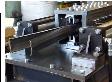
【配管縦割り装置から排出される切断配管】